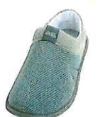
フォレストグリーン